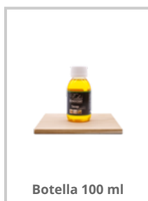
Botella 100 ml